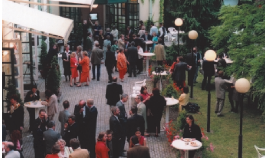
Sommerfest der DA

Das Treffen beginnt mit dem großen Sommerfest der DA, das heuer – einem vielfach geäußerten Wunsch entsprechend – am Freitag Abend stattfindet. Wir hoffen, damit möglichst vielen Absolventinnen und Absolventen –