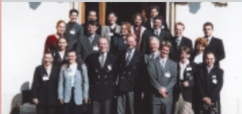
StudentInnen aus allen Lg. in Hernstein