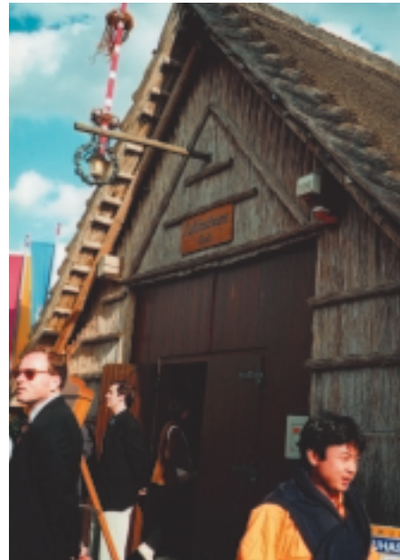
Besuch im Burgenland, Juni 2001

Mit der Vergabe eines Stipendiums in der Höhe von EUR 2500 für das Studienjahr 2002/03 des M.A.I.S.-Lehrganges, hat der Club DA sein Engagement für den aktuellen Lehrbetrieb neuerlich unter Beweis gestellt. Ein evt. weiteres Stipendium für das Studienjahr 2003/04 wird Gegenstand der Beratungen der Generalversammlung 2002 sein. Dabei wird auch das Konzept einer eigenen Website des Club DA, welche im Laufe des Herbst 2002