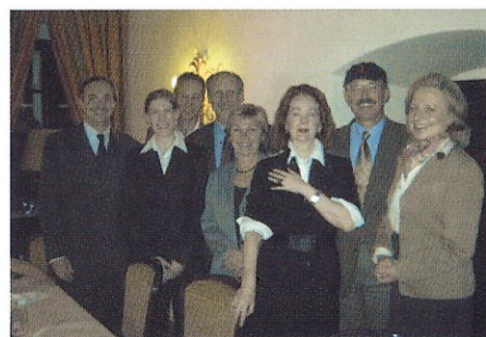
Absolventen der DAK beim regionalen Meeting in Salzburg

Wir haben dieses Semester mit vielen neuen Vorhaben begonnen. Der gemeinsame Besuch von Theatervorstellungen und Ausstellungen soll das „Angenehme mit dem Nützlichen“ verbinden. Dass sich Kulturgenuß und Club-Leben bestens miteinander vereinbaren lassen, hat uns einmal mehr die Führung durch die Ausstellung „Tamara de Lempicka“ im Kunstforum am 20. November gezeigt.