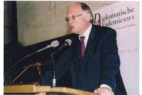
Kommissar Verheugen bei seiner Rede im Rathaus